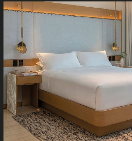
HOTEL ST. REGIS CAP CANA Punta Cana, Rep. Dominicaine