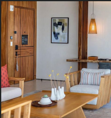
NOBU HOTEL LOS CABOS Cabo San Lucas, Mexique