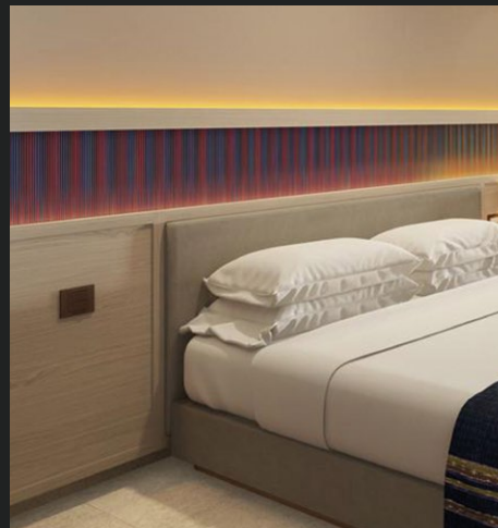
HÔTEL HYATT CAP CANA Punta Cana, Rep. Dominicaine