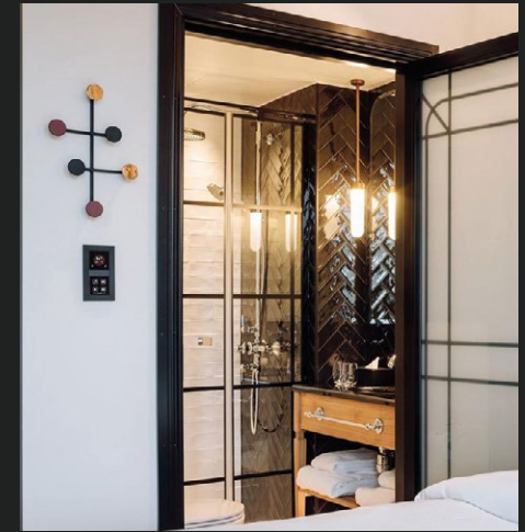
HÔTEL AMERIKALINJEN Oslo, Norvège