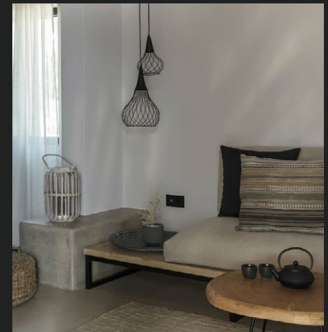
HÔTEL MINOS BEACH ART Crète, Grèce