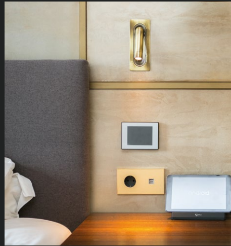
HÔTEL ALMANAC Barcelone, Espagne