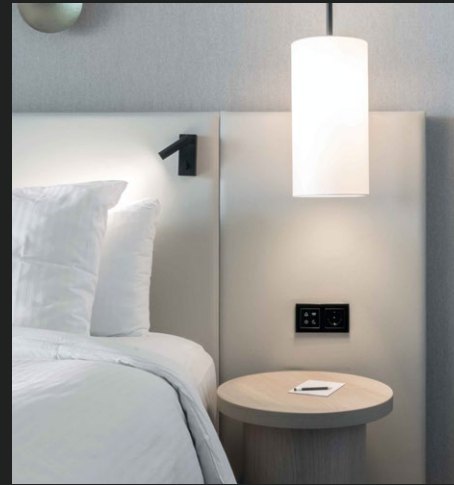
HÔTEL DE BLANKE TOP Cadzand, Pays-Bas