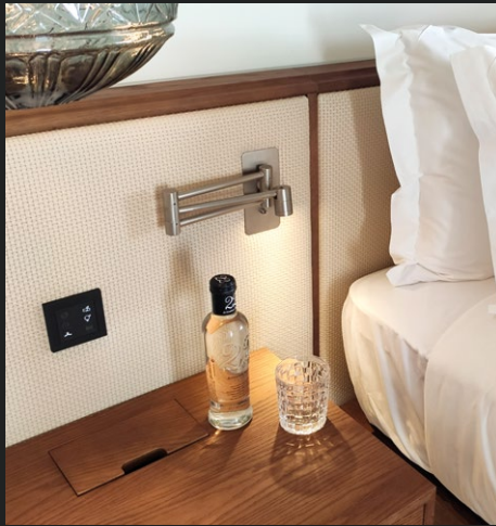
HÔTEL SIX SENSES Ibiza, Espagne